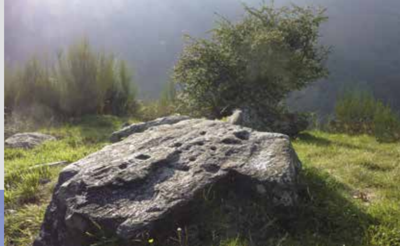
◀ La Calancasca tra Arvigo e Selma ▶ Masso cuppellare lungo il sentiero di Circolo

La Val Calanca nasce nel Gruppo montuoso dell'Adula, nel cuore delle Alpi, e si apre sui vigneti della bassa Val Mesolcina. È solcata dalla Calancasca, le cui sorgenti sgorgano ai piedi dello Zapporthorn, che culmina a 3152 m.