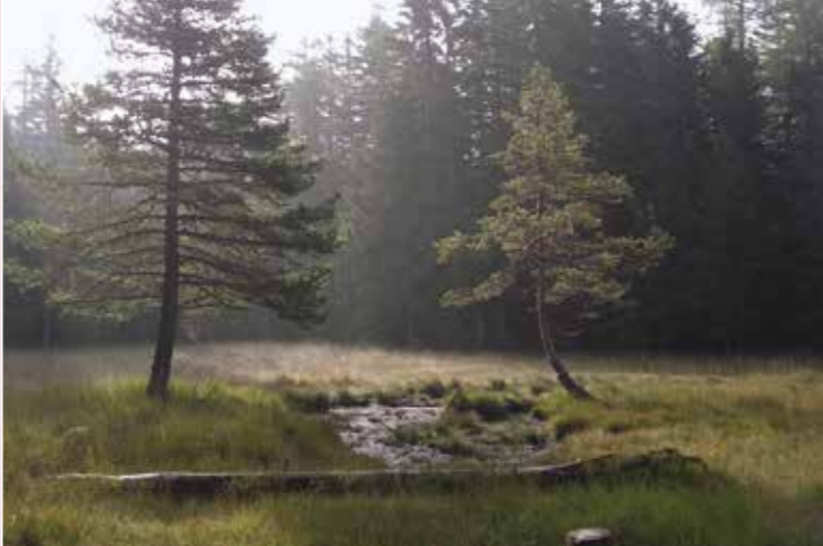
▶ Das Hochmoor auf dem Pian di Scignan