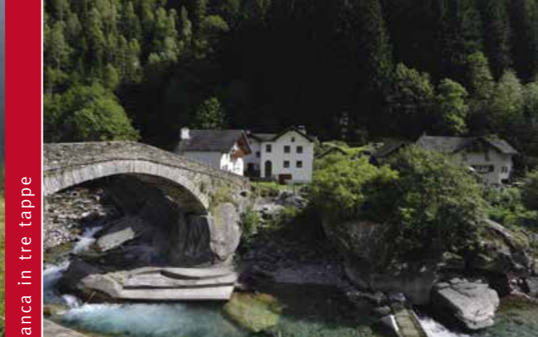
▶ Il ponte a schiena di asino, Arvigo

La storia del popolamento dei terrazzi di Castaneda e Santa Maria vanta origini millenarie, come lo esprime il rinvenimento di un insediamento della fine del neolitico, ed è legata alla sottostante via di transito del San Bernardino, ponte fra il mondo mediterraneo e quello continentale. Gli insediamenti più antichi della valle interna sono posteriori all'Anno mille e fino al secolo scorso furono contraddistinti dalla pratica della transumanza su tre livelli, dal fondovalle ai monti e agli alpi, come pure dalle frequenti migrazioni di genti attraverso i passi alpini trasversali.