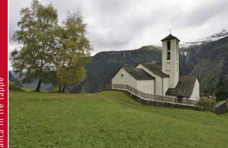
▶ La chiesa di San Bartolomeo, Braggio

Da Santa Maria un sentiero conduce ai monti di Bald (1220 m) da dove lo sguardo spazia sulle valli laterali della Mesolcina e sul Piano di Magadino. Il sentiero s'inerpica fino alla torbiera del Pian di Scignan (1500 m) e al pianoro della cappella di Sant'Antoni de Bolada (1674 m) da dove si gode di una vista impareggiabile sulla Calanca, prima di scendere verso Braggio (1320 m).