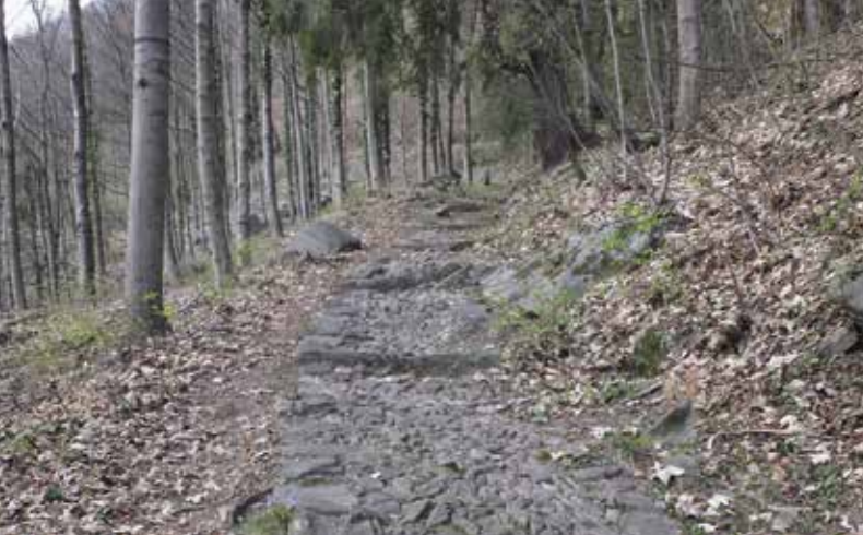
◀ Santa Maria ▶ Der Sentiero dei Menò, Castaneda