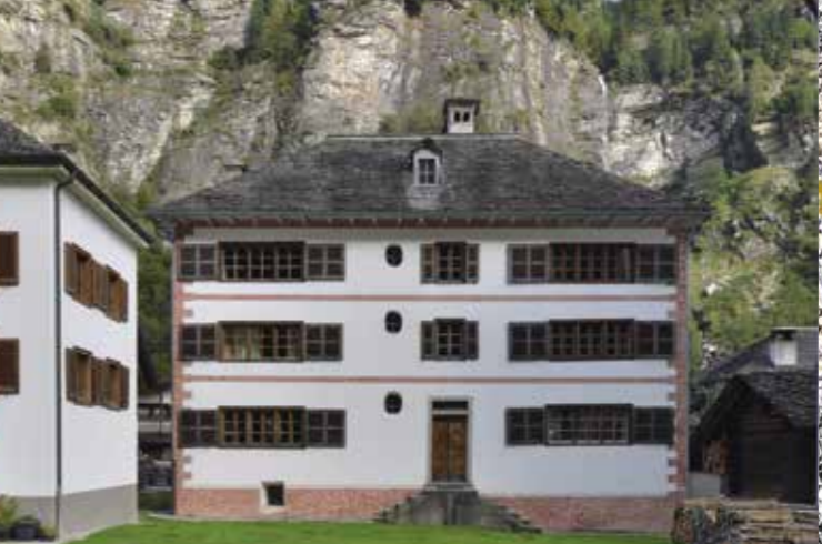
▶ Die Casa Spadino, Augio

Allgemeine Informationen - Informazioni pratiche