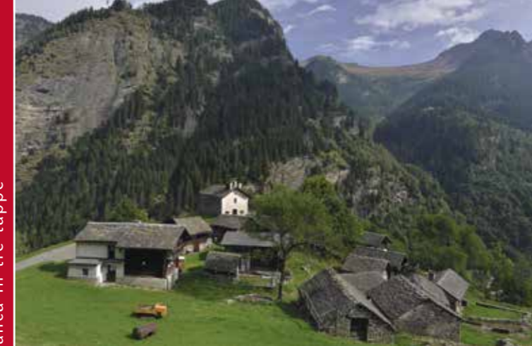
▶ Il nucleo di Masciadone, Cauco

Tra Arvigo e Selma l'itinerario costeggia la sponda sinistra della Calancasca offrendo fiabeschi paesaggi naturali. Dal ponte a schiena d'asino menzionato nel Cinquecento, l'antica mulattiera porta all'improvviso ad uno spettacolare ambiente alpino dominato dallo scorrere impetuoso dell'acqua. Le funivie di Arvigo e Selma collegano il fondovalle ai terrazzi di Braggio (1320 m) e Landarenca (1280 m), raggiungibili anche a piedi percorrendo storiche mulattiere. Le frazioni di Braggio fanno eco al compatto nucleo rurale di Landarenca, un gioiello di architettura di pietra e legno.