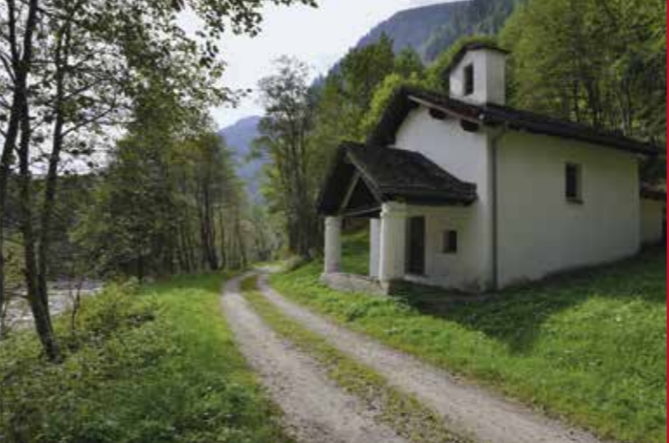
▶ Die Kapelle Madonna Addolorata, Santa Domenica

Allgemeine Informationen - Informazioni pratiche